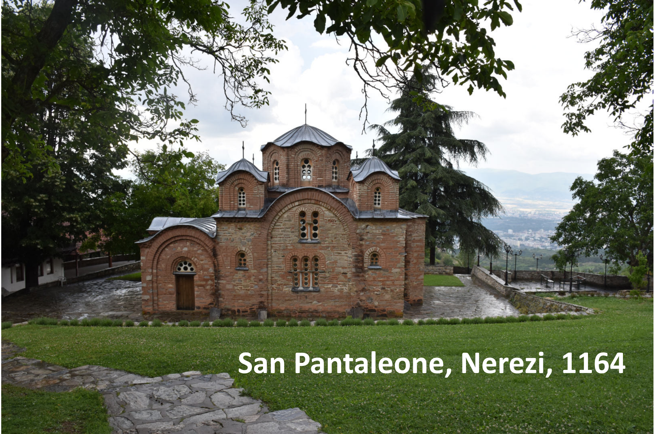
San Pantaleone, Nerezi, 1164