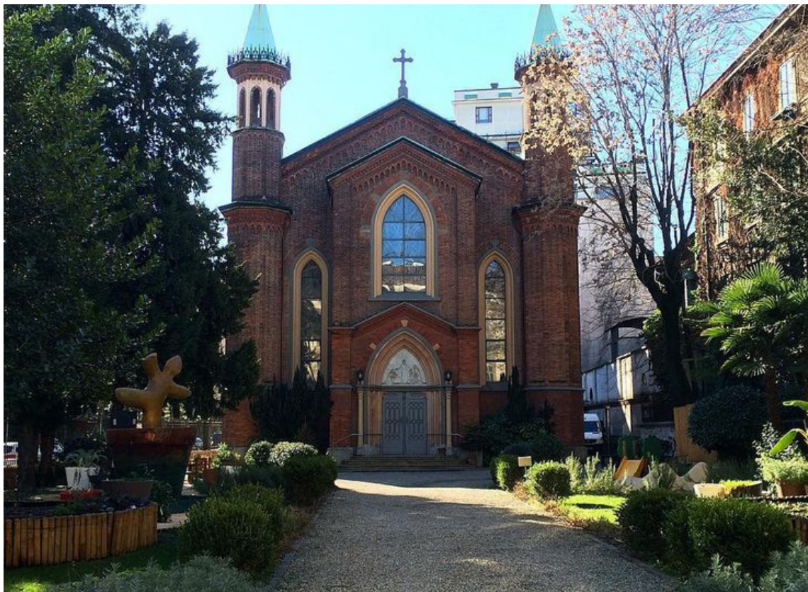
La CCPM di via de Marchi

Uno dei compiti principali della comunità è sempre stato quello di trovare il modo di vivere assieme sotto questo tetto comune. Soprattutto durante le crisi del XIX secolo, con le due guerre mondiali, i diversi ruoli dei due Paesi