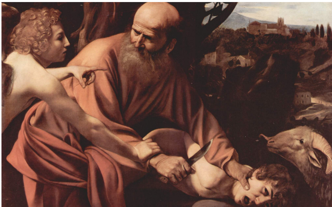
Il sacrificio di Isacco, Caravaggio

tire quale unico criterio attendibile dell’agire sarebbe imposta dall’altro principio, logicamente precedente e indubitabile, e cioè il tratto autonomo dell’agire buono. Non può essere buono un comportamento che obbedisca a imparativi diversi da quelli che io stesso mi do, o più precisamente che mi suggerisce la mia stessa coscienza. E che cos’è la mia coscienza se non appunto il mio modo di sentire? Non posso soggiacere ad