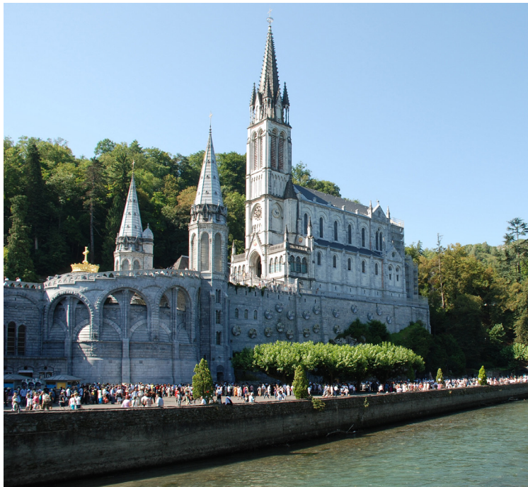
Il santuario di Lourdes

Certo il nostro pellegrinaggio non sarà scandito dai nostri passi, eppure anche noi lasceremo la nostra casa, la nostra città, le nostre occupazioni per andare verso un luogo che è misterioso anticipo della città futura. Compriamo il