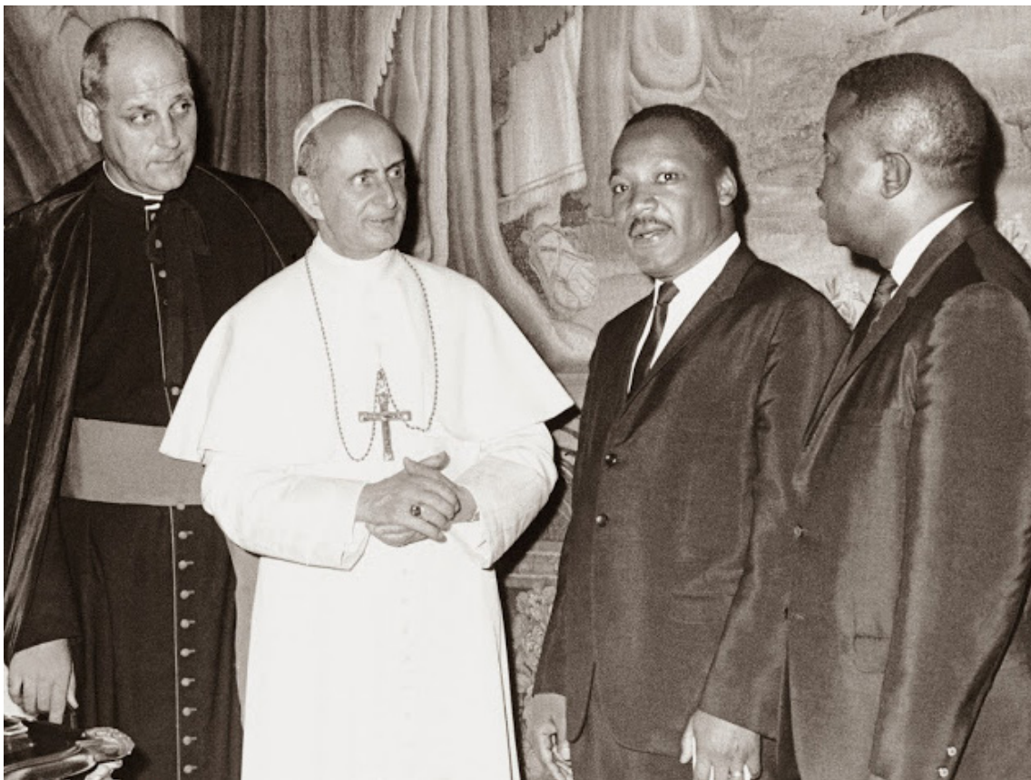
Paolo VI e M. Luther King

ne e violenza. Quella battista è una chiesa sempre alla ricerca del modo più opportuno per tradurre l'E-vangelo in una pratica di giustizia sociale, di amore (anche per i nemici), quale strumento di resistenza e di cambiamento della chiesa e dell'intera società».