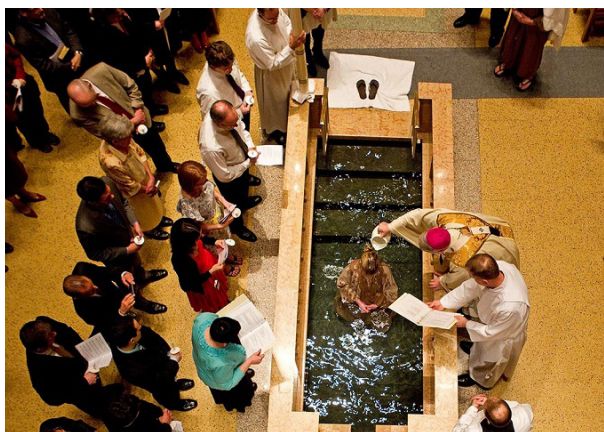
Battesimo per immersione