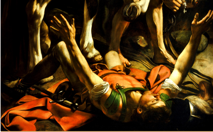
Conversione di san Paolo, Caravaggio

lore”, l'impronta del volto stesso di Dio nostro Padre. Dagli anni del Concilio è in uso anche un'altra formula: « Convertiti e credi al Vangelo », che riprende le prime parole pronunciate da Gesù annunciando il Vangelo (Mc 1,14s.). Preziosi i due verbi che potrebbero esser tradotti più esattamente così: cambia il tuo modo di pensare e affidati al Vangelo. E chi riceve le ceneri risponde: mi convertirò ogni giorno. E non solo nei quaranta giorni quaresimali questa parola dovrebbe guidare il nostro vivere. Siamo soliti pensare la conversione come una situazione eccezionale, un evento clamoroso, che trasforma radicalmente l'esistenza di una persona. L'esempio più consueto è quello di Saulo-Paolo disarcionato da cavallo sulla via di Damasco: in quella caduta e nel bagliore che lo acceca il persecutore dei discepoli di Gesù diviene, a sua volta, discepolo. Ricordo un'altra conversione, addirittura non voluta. Ogni anno, durante il soggiorno estivo a Parigi faccio un piccolo pellegrinaggio fino alla chiesa di sant'Agostino, nel cuore della città. Nella terza cappel-