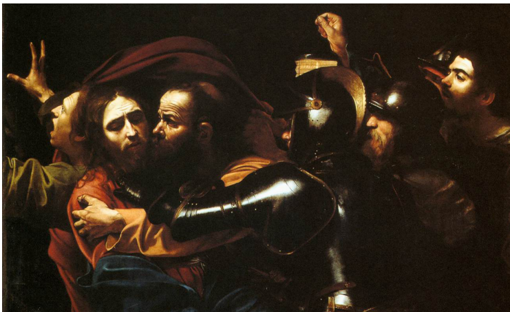
Cattura di Cristo, Caravaggio

Giuda s'era accordato con i capi per trenta denari. L'accordo era stato fatto per i soldi? Per amore del denaro? Improbabile. I motivi veri del tradimento del Maestro non li avrebbe saputi dire bene neppure lui. Era troppo complicato spiegare. E le sue ragioni, oltre tutto, proba-