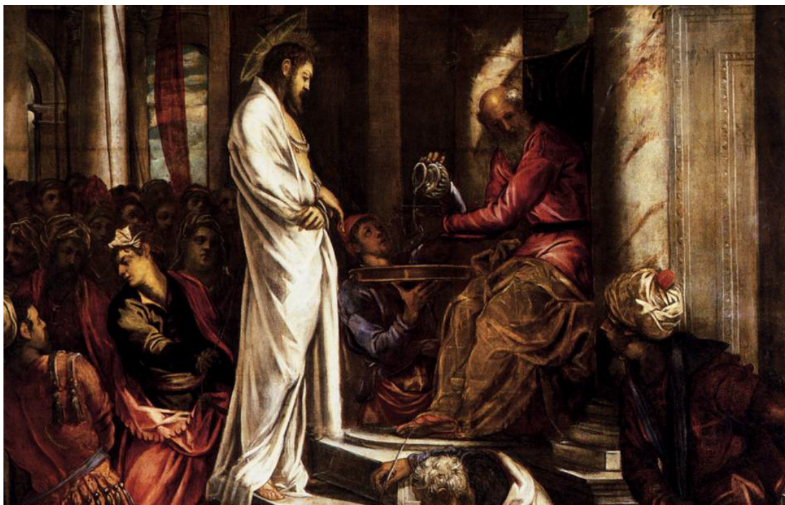
Cristo davanti a Pilato, Tintoretto

bilmente non avrebbero interessato nessuno. Finse che gli interessasse i soldi. Con il Sinedrio era più facile firmare un contratto, che esprimere dubbi e cercare consensi. Quando poi vide Gesù condannato dal Sinedrio, si pentì del suo gesto. Confessò di aver tradito sangue innocente, cercò in qualche modo comprensione e solidarietà. Ma non la trovò. Si aspettava che i capi del Sinedrio rivedessero la loro decisione? Magari no, ma almeno che gli dicessero: “Stai tranquillo; la colpa non è tua; lo avremmo preso comunque”. Un riconoscimento del genere avrebbe attenuato il suo senso di colpa. Invece gli dissero: “Che ci importa? Arrangiate!”. Così sono sempre i patti conclusi per denaro: non garantiscono alcun legame; sanciscono la reciproca estraneità. Il denaro apparve poi agli occhi di Giuda una maledizione. Lo gettò